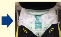
スマートフィット

超うす型吸収体のため、おしりまわりや足まわり、股下がすっきりしているので不快感が軽減し、足も閉じやすく、座位が安定します。安定した座位姿勢の保持は円背や褥瘡、誤嚥のリスクに配慮でき、呼吸の安定にもつながると考えられます。