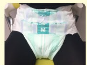
厚みのあるテープ止めタイプ